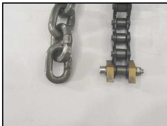
Kraftig ankerkæde i hårdt stålmateriale og Kæde med 2 hårdmetalsplatter.